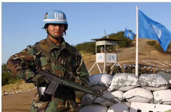
Ein bolivianischer Soldat bewacht einen Beobachtungsposten, 2002

Wie bereits in den Vorjahren haben auch 2017 Studierende über den BSH an der zweiwöchigen Simulation „UN Mission HQ“ an der Führungsakademie der Bundeswehr teilgenommen. Dabei haben sie nicht nur Einblicke in den Ablauf einer Peacekeeping-Mission erhalten, sondern konnten sich auch mit den anwesenden Experten über deren Praxiserfahrungen im Einsatz austauschen. Ein Bericht wird in Kürze auf der BSH Website veröffentlicht.