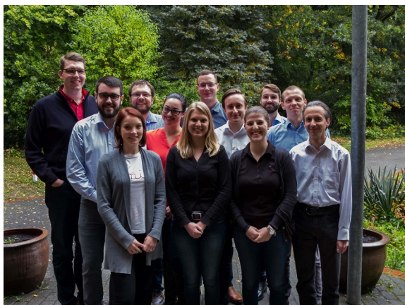
Dritte Klausurtagung des Erweiterten Bundesvorstandes in Bonn

Der BSH-Bundesvorstand tagte am 20. Juli und 8. August per Telefonkonferenz. Vom 29. September bis 1. Oktober trafen sich die Mitglieder des Erweiterten Bundesvorstands auf dem Venusberg in Bonn zur letzten Klausurtagung dieser Legislaturperiode. | Bericht