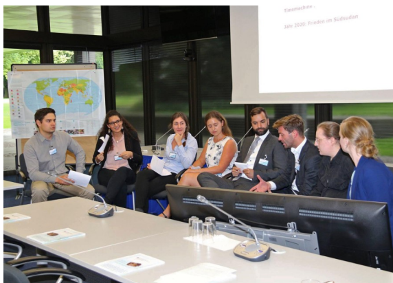
Einige Teilnehmer des Seminars im Bundesministerium für wirtschaftliche Zusammenarbeit und Entwicklung (BMZ): Vor Ort wurde in einer Simulation nach einem Friedensvertrag für den Südsudan gesucht

fe, bei dem die Teilnehmer Einblicke in die Gefahren bekamen, denen Entwicklungshelfer alltäglich während ihrer Tätigkeit ausgesetzt sind.