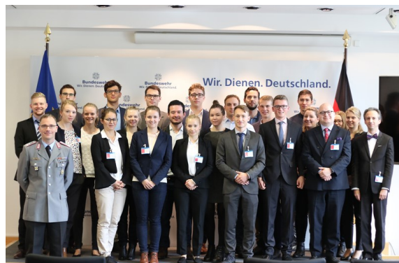
Gruppenfoto der XXX. Grundakademie beim Besuch im Verteidigungsministerium

Die Teilnehmerinnen und Teilnehmer diskutierten unter anderem im BMVg über die